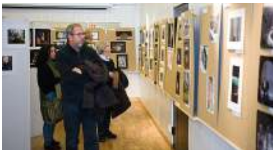
Utställda SVEFO-bilder i Skarpnäcks Kulturhus.

Söndagen den 13 november var det distriktsstämma för Östra Svealands Fotoklubbar och redovisning av SVEFO-utställningen. Som arrangör stod Enskede FK och vi träffades i Skarpnäcks kulturhus.