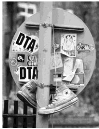
Converse (London)