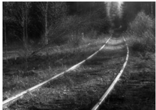
Rälsen ( Freluga)