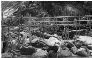
Bron (Thailand)