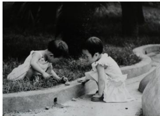
Lekande barn ( Kina )