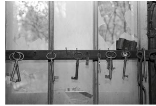
Ordning och reda, (Vallsta ångsåg)