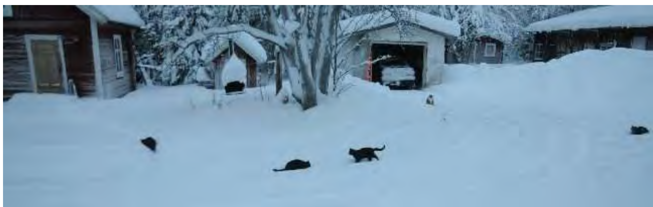
Inte heller katter gillar årets norrbottensvinter