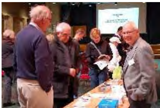
FFiM-kasören Wolfgang Gerlach sålde utställningskatalogen under pauserna i bildvisningen.