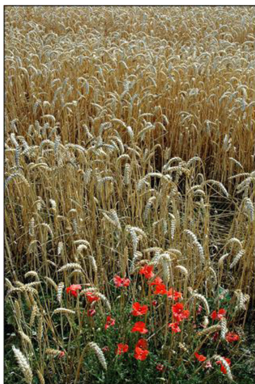
Thord Ehnbergs vinnarbild "Rödgrön röra"