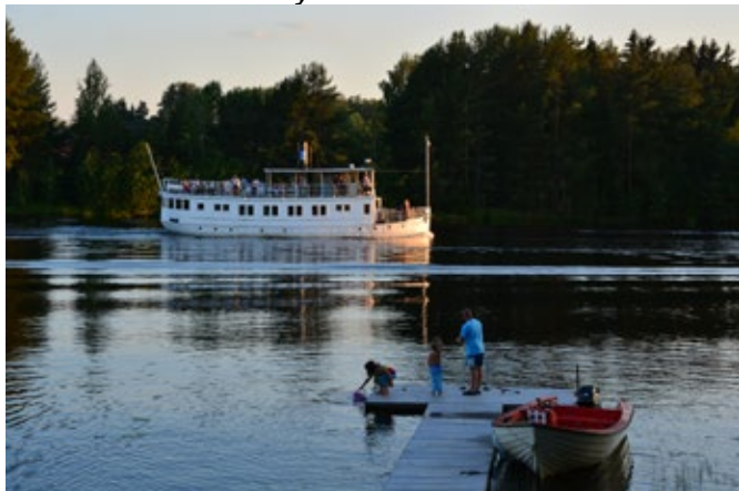
s/s Warpen

Du är varmt välkommen till Bollnäs Fotoklubb och Hälsingland – ”Linlandet.”